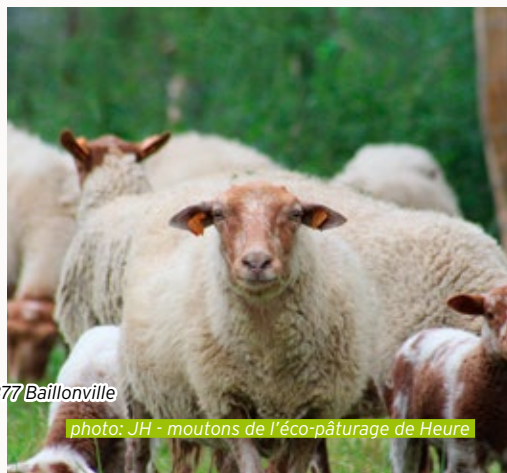
moutons de l'éco-pâturage de Heure

vue d'une oeuvre de sentier d'art photo: sentier d'art.