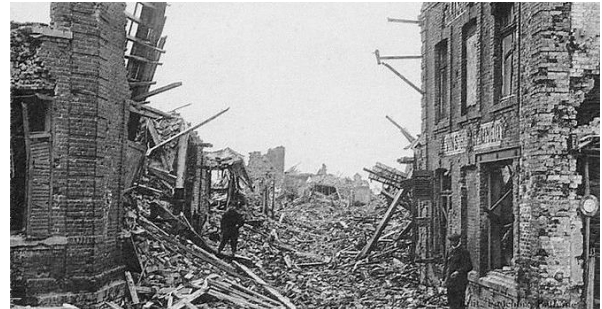
Lens ou Kiev, même constat de désolation

Mais pas de n'importe quelle manière. L'occupant, soucieux de dissimuler au mieux les événements en cours, avait mené l'évacuation par la Belgique, avec comme objectif final le retour vers la France libre en passant par le Luxembourg, puis un « couloir humanitaire » entre la France et l'Allemagne avant de rejoindre la Suisse, et ainsi accéder au sud de la France.